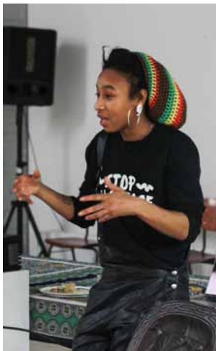
Sfeerbeelden van Vrijwilligersdag 15/12